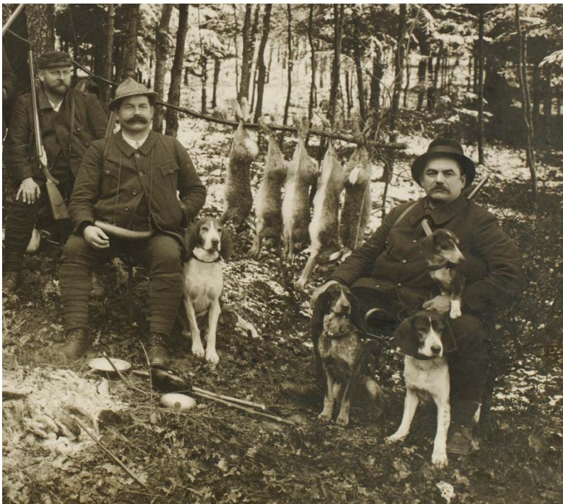
Jagd am Born, 1912