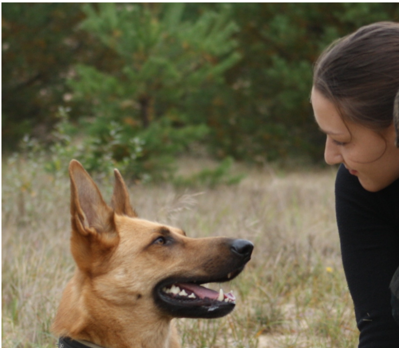
Mensch und Hund – emotional verbunden